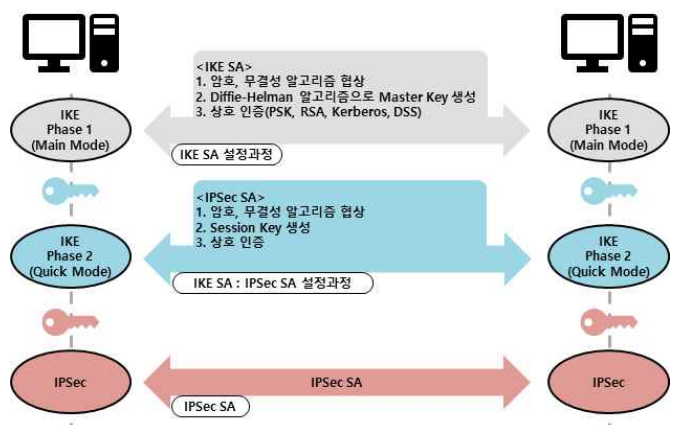
그림 1 IPSec 동작 과정

IPSec은 호스트 간, 호스트와 보안 게이트웨이 간 및 보안 게이트웨이 간의 경로를 보호할 수 있는 기술이다. 보안을 위하여 IKE(Internet Key Exchange)를 통해 두 통신단 사이의 암호키와 필요한 정보를 교환하며, 인증 헤더(Authentication Header) 프로토콜과 ESP(Encapsulated Security Payload) 프로토콜을 사용하여 보안을 제공한다. AH 프로토콜을 통해 출발지 인증, 데이터 무결성, 재현 공격 방지 서비스를 사용할 수 있으며, ESP 프로토콜을 통해 AH 프로토콜이 제공하지 않는 기밀성까지 확보할 수 있다. 또한, IPSec은 두가지 모드가 존재한다. 트랜스포트 모드는 호스트 간의 종단간 통신을 보호할 수 있으며, IP 상위의 프로토콜 정보를 인터넷을 통해 안전하게 전달할 수 있다. 이는 로컬 네트워크 내의 타 호스트들을 신뢰할 수 없을 때 특정 호스트 간 통신을 보호하기 위해 사용된다. 다른 모드로는 터널 모드가 있으며, 로컬 네트워크 간의 또는 로컬 네트워크와 호스트 간의 통신을 보호하기 위해 사용된다. 이를 통해 로컬 네트워크 내 모든 호스트들의 통신을 보호할 수 있다.